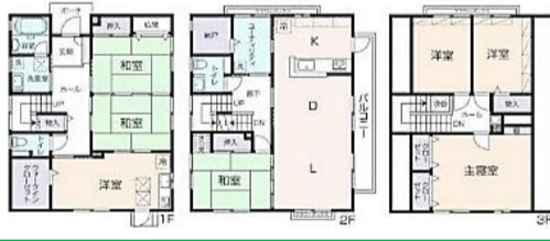
ナビ 松山市春日町8-10