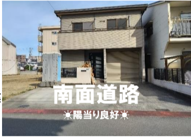
ナビ 松山市木屋町1丁目8-3

土地：144.48㎡ (43.70坪) 建物：111.00㎡ (33.57坪) 築年月：平成9年3月築 構造：木造亜鉛メッキ鋼板ぶき2階建 間取り：3LDK 駐車場：3台可 交通：本町四丁目電停より徒歩約3分 本町バス停より徒歩約2分 学区：味酒小/勝山中