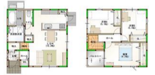
ナビ住所：松山市西長戸町317-7